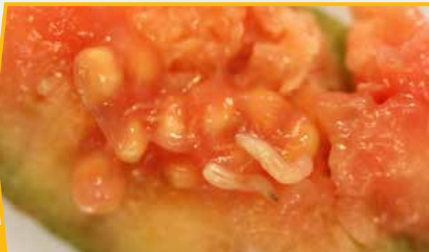
Fruit fly larvae on guava.

O fualaa suamalie ma fualaaaina e le o sao mai e aofia ai le: avoka, ulu, moli, mandarin, ma isi ituaiga fualaa suamalie, esi, pasio, kuava, mago ma tamato.