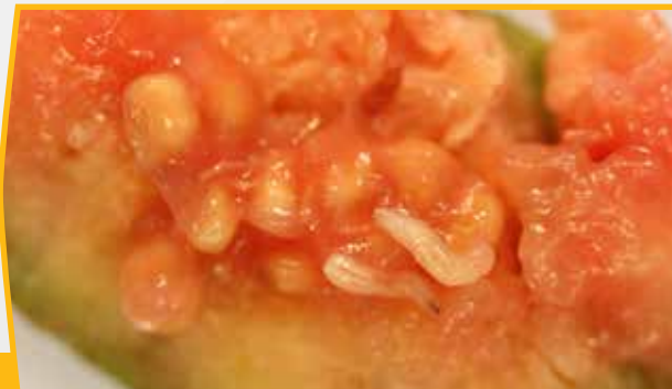
Fruit fly larvae on guava.

'Oku 'i ai 'a e fa'ahinga lango fakatu'utāmaki 'oku ne fakatupu 'a e hūhūkia 'o e fua'i'akaú (Lango Hūhūkia) na'e ma'u 'i Otago 'i 'Aokalani. 'Oku 'i ai 'a e tokanga lahi ki he lango fakatupu hūhūkia ko 'eni he 'oku malava ke nau uesia mo maumau'i lahi 'a e fua'i'akaú mo e vesitapolo 'o Nu'usila ni. 'Oku mau fu'u fiema'u ho'o tokoní ke ta'ofi kinautolu mei he 'enau mafola holo ki he ngaahi ngoue'anga fua'i'akaú mo e vesitapoló.